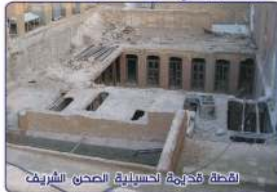
لقطة قديمة لحسنية الصحن الشريف

فالصحن الشريف هو أول مدرسة لتدريس العلوم الدينية في النجف الأشرف.