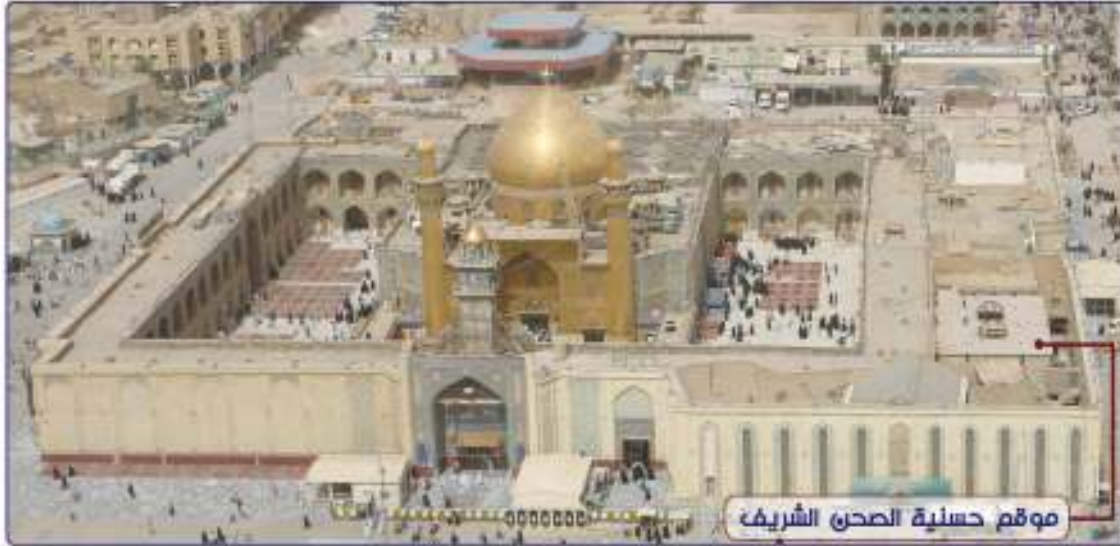
موقع حسنية الصحن الشريف

وقد تضمن العمل مرحلتين الأولى شملت أعمال الحفر بعمق ٦م وصب الأسس ووضع قواعد الأعمدة وتثبيت الجسور الرئيسية للسقف والتغليف بالطابوق والاكساء بمادة الاسمنت والمرحلة الثانية إضافة مساحة أخرى تمتد حتى الركن الشمالي الشرقي للعتبة لزيادة مساحة الحسينية لتستوعب أكبر عدد من الزوار .