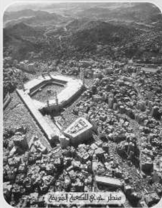
منظر عام للكعبة المشرفة

جاء في تفسير قوله تعالى ﴿والأرض بعد ذلك دحاها﴾ أي بسطها ومدّها بعد ما بنى السماء ورفع سمكها وسواها، وأغطش ليلها وأخرج ضحاها وذكر بعض المفسرين أن الدحو بمعنى الدحرجة. وقال علماء اللغة: دحا الله الأرض أي بسطها ودحا الحجر بيده: رمى به، ودحا المطر الحجر عن وجه الأرض أي دفع به. وقد بسط الله عزوجل الأرض من مركزها وهي الكعبة المشرفة ويوضح ذلك قول الإمام علي بن موسى الرضا صلوات الله عليه: وعلة وضع البيت (أي الكعبة المشرفة) وسط الأرض: أنه الموضع الذي من تحته دحيت الأرض... وهي أول بقعة وضعت في الأرض: لأنها الوسط، ليكون الغرض لأهل الشرق والغرب في ذلك سواء.