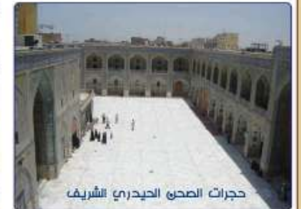
حجرات الصحن الحيدري الشريف

كان يسكن هذه المدرسة أغلب العلماء ومنهم المقدس الأردبيلي (قدس سره) إذ تحوي أكثر من ٤٠ حجرة يسكنها طلبة العلم حتى وقت قريب ولكنها أخليت بعد انتفاضة صفر عام ١٣٧٧هـ الموافق لعام ١٩٧٧ وبقيت مهملة حتى أعيد تأهيلها من قبل لجنة الاعمار في العتبة العلوية المقدسة.