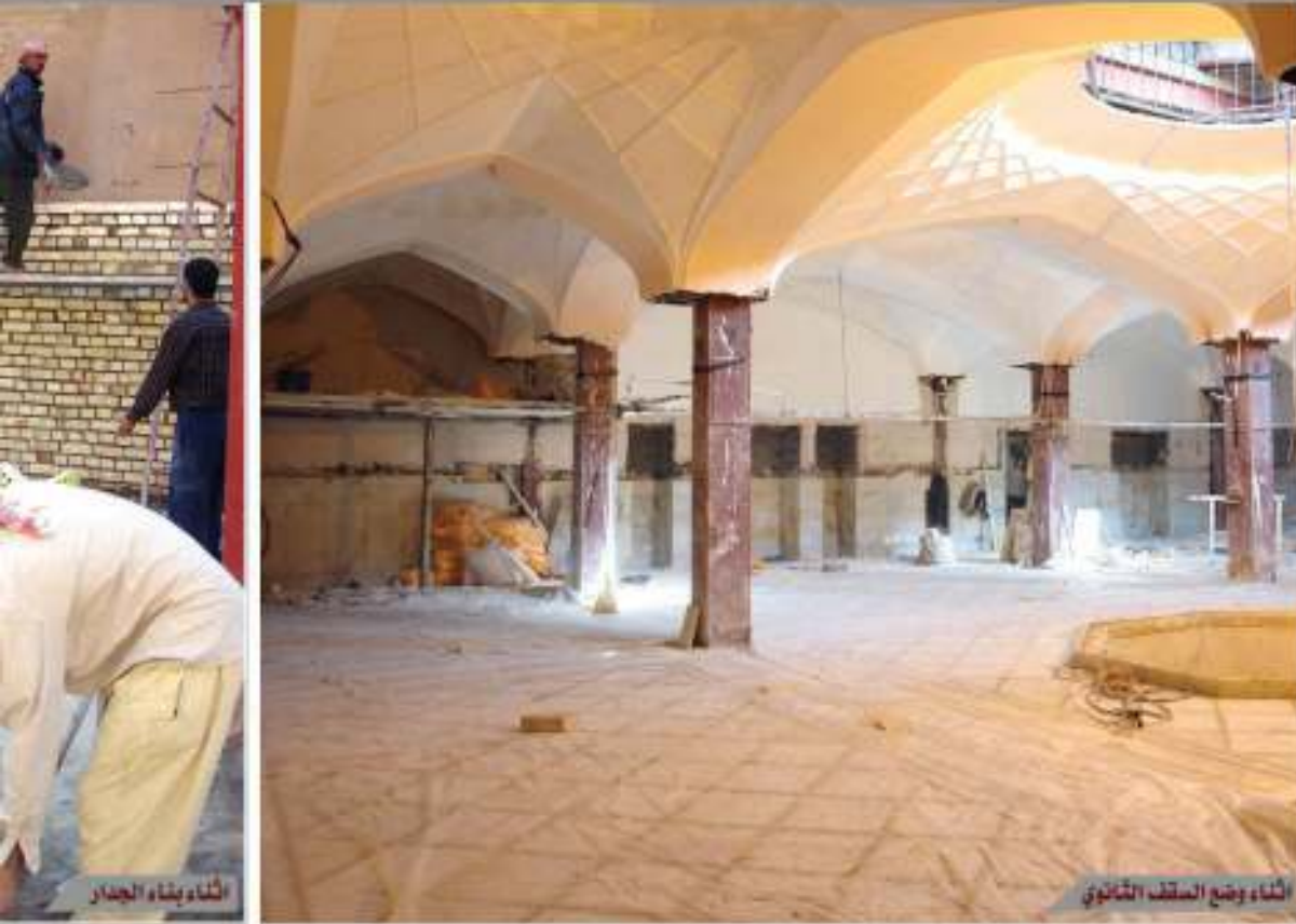
البناء بقاء الجدار