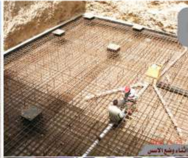
البناء وضع الاساس