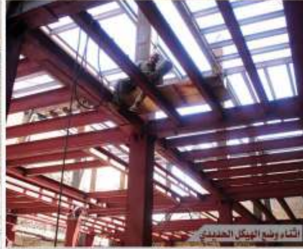
البناء وضع الهيكل الحديدي