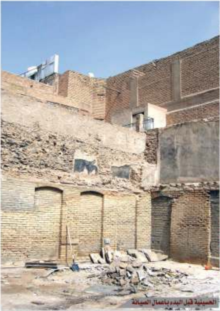
الحسينية قبل البدء بأعمال الصيانة